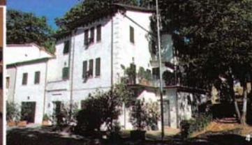
SETTE QUERCE: 1 Die Küche mit Dachterrasse. 2 und 3 Wohn- und Schlafraum im Stil von Tricia Guild: buntgemusterte Baumwoll-Stoffe und klare Formen. 4 Einst neben sieben Eichen erbaut: die Villa „Sette Querce“.