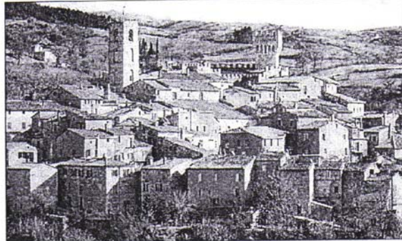
Una veduta di San Casciano dei Bagni, in provincia di Siena dove è in corso il progetto cultura "Viandanti". Accanto, "La Bestia" di Bizhan Bassiri, l'opera che verrà inaugurata domani in piazza Matteotti