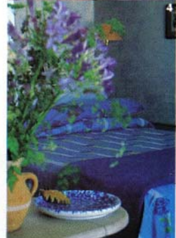
3. In una suite, il tradizionale camino in pietra. 4. Una camera nei toni dell'azzurro. 5. Il piacere di una ricca colazione servita in uno dei terrazzi privati.